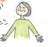
あおい薬局 5月予定表

日光を浴びると、精神安定に欠かせない脳内神経伝達物質のセロトニンが分泌されて、気持ちが安定します。